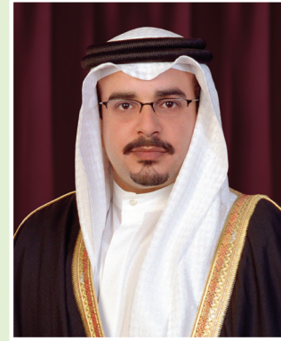
صاحب السمو الملكي الأمير سلمان بن حمد آل خليفة ولي العهد نائب القائد الأعلى