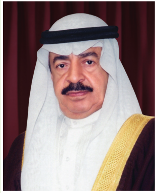
صاحب السمو الملكي الأمير خليفة بن سلمان آل خليفة رئيس الوزراء الموقر