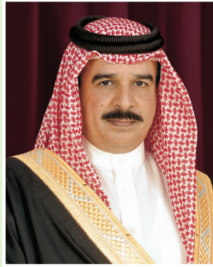
حضرة صاحب الجلالة الملك حمد بن عيسى آل خليفة ملك مملكة البحرين