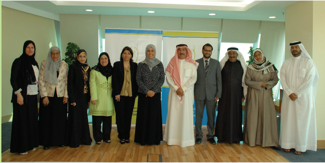
اعضاء اللجنة الوطنية لكبار السن

تم إعادة تشكيل اللجنة الوطنية للمسنين بقرار رقم ٧٩ لسنة ٢٠١١ والصادر من مجلس الوزراء الموقر. على أن تكون اللجنة برئاسة الدكتورة فاطمة محمد البلوشي وزيرة حقوق الانسان والتنمية الاجتماعية وعضوية كل من: